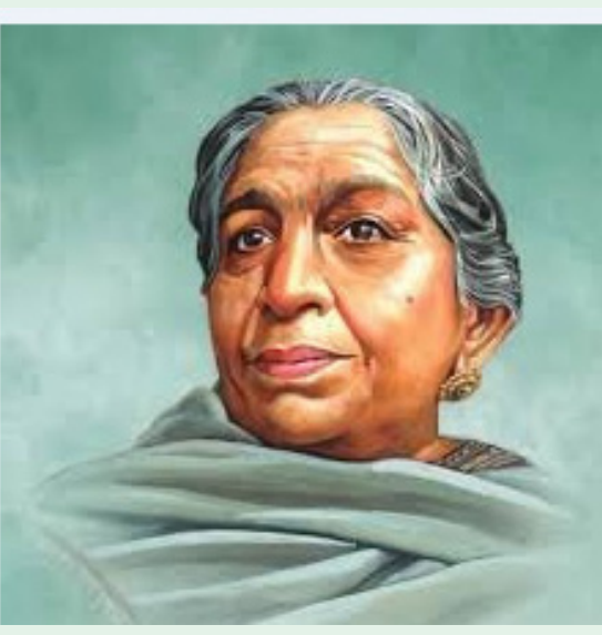
నాయుడు కొన్నిరచనలు: ?గోల్డెన్ ట్రెషోల్డ్ అనే మొదటి కావ్య సంకలనాన్ని ఆమె 1905లో ప్రచురించారు.?ది బర్డ్ ఆఫ్ టైం: సాంగ్స్ ఆఫ్ లైఫ్ డెత్ అండ్ ది స్ప్రింగ్.?ది ఇండియన్ వీవర్స్.?ది బాంగిల్ సెల్లెన్స్..అంతర్జాతీయ మహిళా దినోత్సవాన్ని ప్రతి సంవత్సరం మార్చి 8న ప్రపంచవ్యాప్తంగా జరుపుకుంటారు. =====

ఉద్యమం మరియు క్విట్ ఇండియా ఉద్యమానికి నాయకత్వం వహించిన ప్రధాన వ్యక్తులలో సరోజిని ఒకరు. ఆ సమయంలో బ్రిటిష్ అధికారులచే ఆమె పదే పదే అరెస్టులను ఎదుర్కొంది మరియు 21 నెలలకు పైగా (1 సంవత్సరం 9 నెలలు) జైలులో గడిపింది. ఆమె 1925లో భారత జాతీయ కాంగ్రెస్ అధ్యక్షురాలిగా నియమితులయ్యారు మరియు తరువాత 1947లో యునైటెడ్ ప్రావిన్సెస్ గవర్నర్ అయ్యారు, భారతదేశంలో గవర్నర్ పదవిని నిర్వహించిన మొదటి మహిళగా నిలిచారు.ఆమె అనిబెసెంట్ తర్వాత జాతీయ కాంగ్రెస్ పార్టీకి రెండవ మహిళా అధ్యక్షురాలిగా 1925లో ఎన్నికయ్యారు. ఆమె 1928లో దేశంలో ప్రభుత్వం ఖైసర్ ఏ హింద్ బిరుదును అందించింది.ఆమె 1947 నుండి 1949 వరకు అగ్రా మరియు ఔద్ సమైక్య ప్రావిన్సుకు తొలి గవర్నరుగా నియమించబడి, దేశంలో తొలి మహిళాగవర్నర్ గా చరిత్రకెక్కారు.తనే దేశం, దేశమే తనగా భావించి దేశ సేవ చేసిన అభేద భావాల మూర్తి రాజకీయ, సాంఘిక, సాంస్కృతిక, సాహిత్య రంగాలలో రకరకాలుగా సేవలు చేసి మానవ సేవ చేయదలుచుకున్న వారికి మార్గాలనేకం అని నిరూపించిన మహిళానితురాలు. జీవితమంతా మానవ సేవకు, దేశసేవకూ అంకితము చేసి తన డబ్బు వ యేట 1949 మార్చి 2 వ తేదీన లక్నోలో ప్రశాంతంగా కన్ను మూసింది.సరోజిని